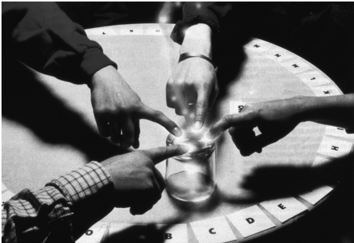
Una ouija .